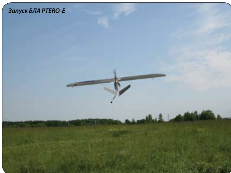
Запуск БЛА PTERO-E