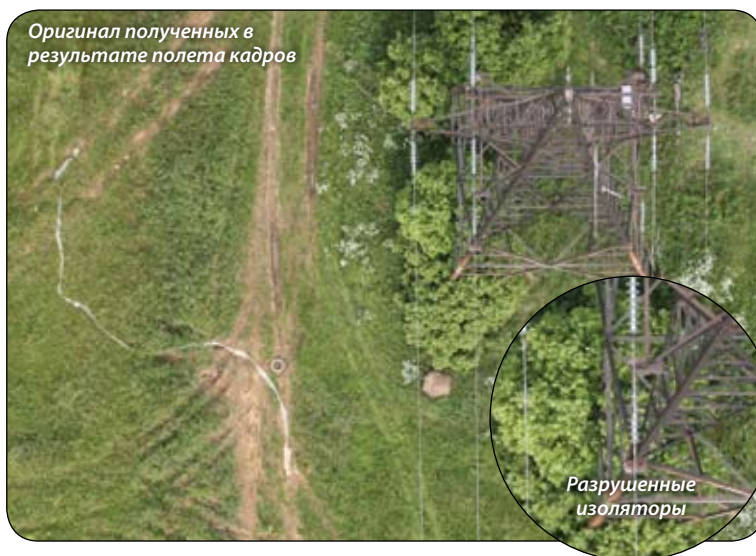
Оригинал полученных в результате полета кадров