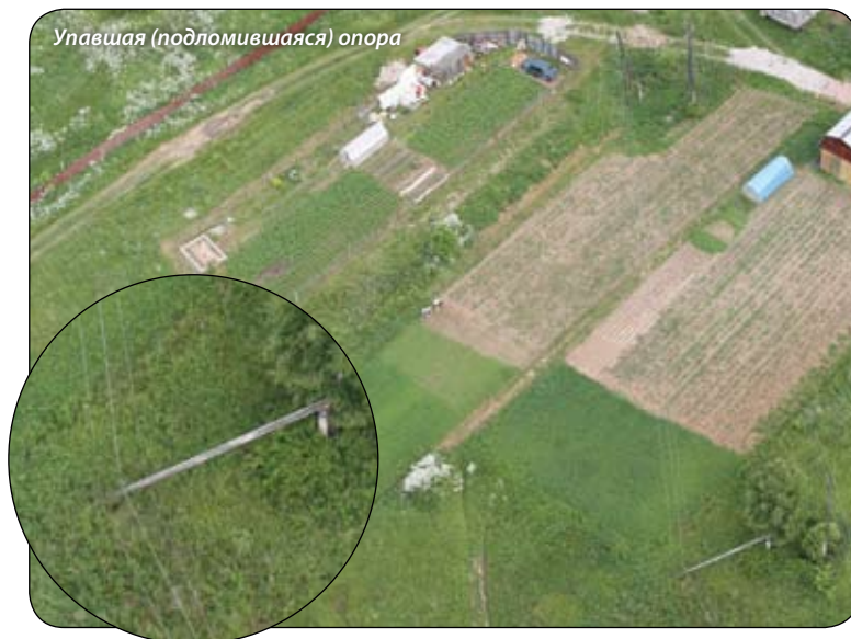
Упавшая (подломившаяся) опора